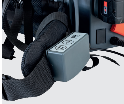
Bedieneinheit am Tragegurt