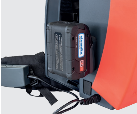
Akkuaufnahme seitlich des Saugers